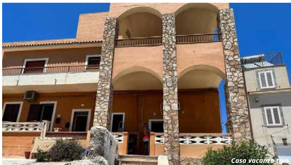
Casa vacanza tipo

A max 2-3 km dagli appartamenti. Lampedusa offre bellissime calette di roccia e sabbia e spiagge di sabbia libere e attrezzate come la Guitgia. La splendida spiaggia dei Conigli si trova a circa 7 km da Lampedusa Paese.