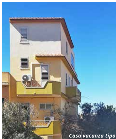
Casa vacanza tipo