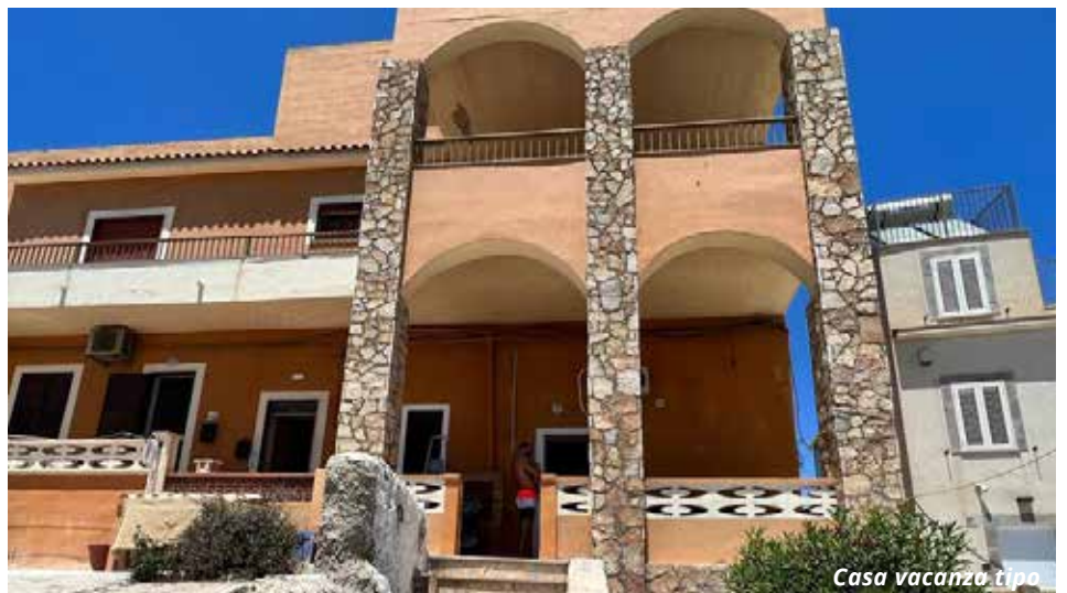
Casa vacanza tipo

A max 2-3 km dagli appartamenti. Lampedusa offre bellissime calette di roccia e sabbia e spiagge di sabbia libere e attrezzate come la Guitgia. La splendida spiaggia dei Conigli si trova a circa 7 km da Lampedusa Paese.