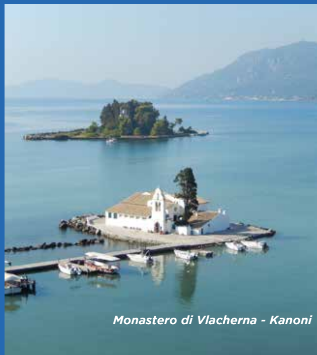
Monastero di Vlacherna - Kanoni

A Ipsos, sul lungomare, c'è l'imbarazzo della scelta per i giovaniche vogliono fare festa fino al mattino, tra pub, disco bar e discoteche. Per chi ricerca locali più selezionati, a Corfù Città si trovano ottimi ristoranti, club e discoteche.